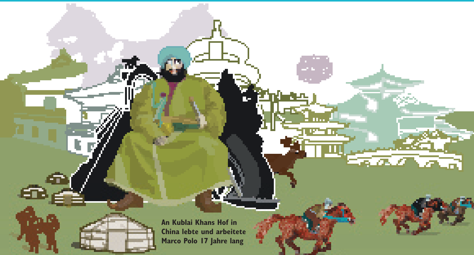
An Kublai Khans Hof in China lebte und arbeitete Marco Polo 17 Jahre lang