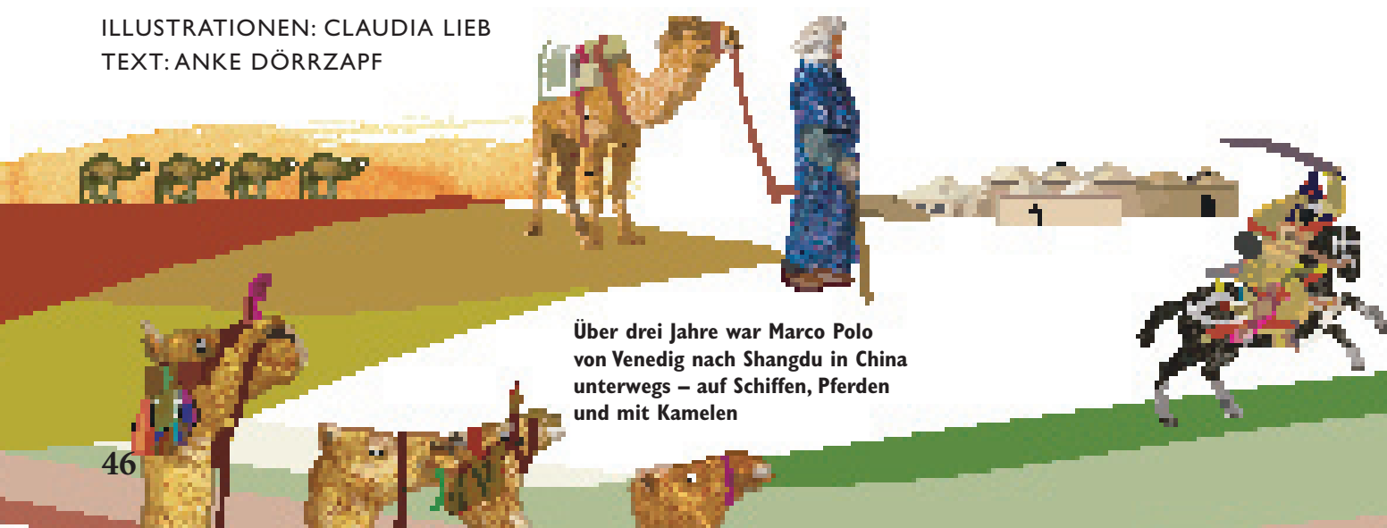
Über drei Jahre war Marco Polo von Venedig nach Shangdu in China unterwegs – auf Schiffen, Pferden und mit Kamelen

ILLUSTRATIONEN: CLAUDIA LIEB TEXT: ANKE DÖRRZAPF