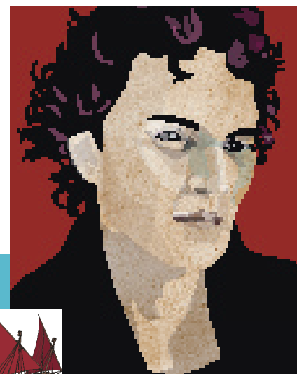
Marco Polo brach 1271 nach China auf – dort herrschten damals die Mongolen